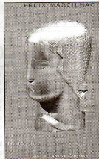
Joseph Csaky, Du cubisme à la figuration réaliste, 400 pages Les Éditions de l'Amateur - 95 €

"Joseph Csaky, Du cubisme à la figuration réaliste" propose sous la forme d'un beau livre, une biographie et une analyse de l'oeuvre de cet artiste installé à Paris en 1908, complétées en fin de volume par le catalogue raisonné de ses sculptures.