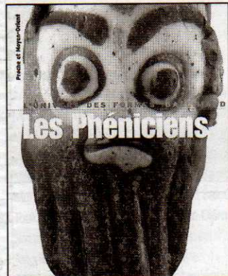
L'Univers des Formes, Éditions Gallimard. 25 €

La collection mythique d'histoire de l'art, L'Univers des Formes, créée en 1960 par André Malraux, poursuit sa renaissance avec la publication fin