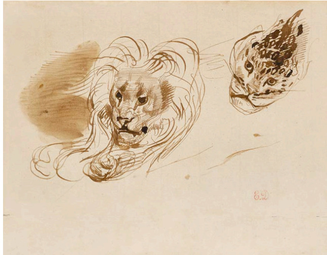
Eugène Delacroix, Lion couché et tête de félin, plume et encre brune, lavis brun, 18 x 23 cm