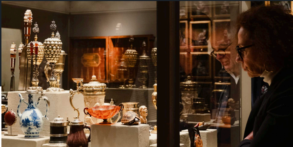
De nombreux marchands et galeries membres du Syndicat National des Antiquaires (SNA) participent au mois de mars à la Tefaf Maastricht et au salon du dessin à Paris.

Créé en 1901, le Syndicat National des Antiquaires (SNA) défend près de 250 marchands français et internationaux. Du 9 au 14 mars, nombre d'entre eux se retrouvent à la Tefaf Maastricht, quelques jours avant le salon du Dessin qui s'ouvre à Paris du 20 au 25 mars.