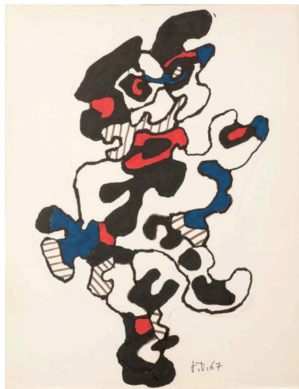
Jean Dubuffet, Personnage (en pied), marker (avec collage) sur papier, 27 x 21,5 cm, 3 janvier 1967, Coll. Fondation Dubuffet, Paris © Fondation Dubuffet / ADAGP, Paris

Invitée d'honneur de l'édition 2024, la fondation Dubuffet est mise en lumière avec une exposition de qualité muséale qui réunit une cinquantaine d'œuvres sur papier réalisées par Jean Dubuffet entre 1935 et 1985. Le salon du Dessin fait également la part belle à la fondation Tavolozza, riche de quelque 1 800 œuvres – peintures, sculptures, photographies, gravures et dessins... – réunis par la collectionneuse Katrin Bellinger.