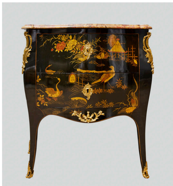
Commode laquée, Paris vers 1750/1760, estampillée D Genty (Denis Genty, maître ébéniste 1754–1762), 82 x 48.5 cm, brèche d'Alep, marbre, bronze doré, Ralph Gierhards

À l'occasion du centenaire de la publication du Manifeste du surréalisme d'André Breton, cette édition est placée sous le signe de l'imagination et du rêve. Elle met à l'honneur la fondation Paul Delvaux et nombre de galeries dévoileront pour l'occasion quelques-unes des plus belles œuvres de Salvador Dalí, Max Ernst, René Magritte, Toyen ou André Masson.