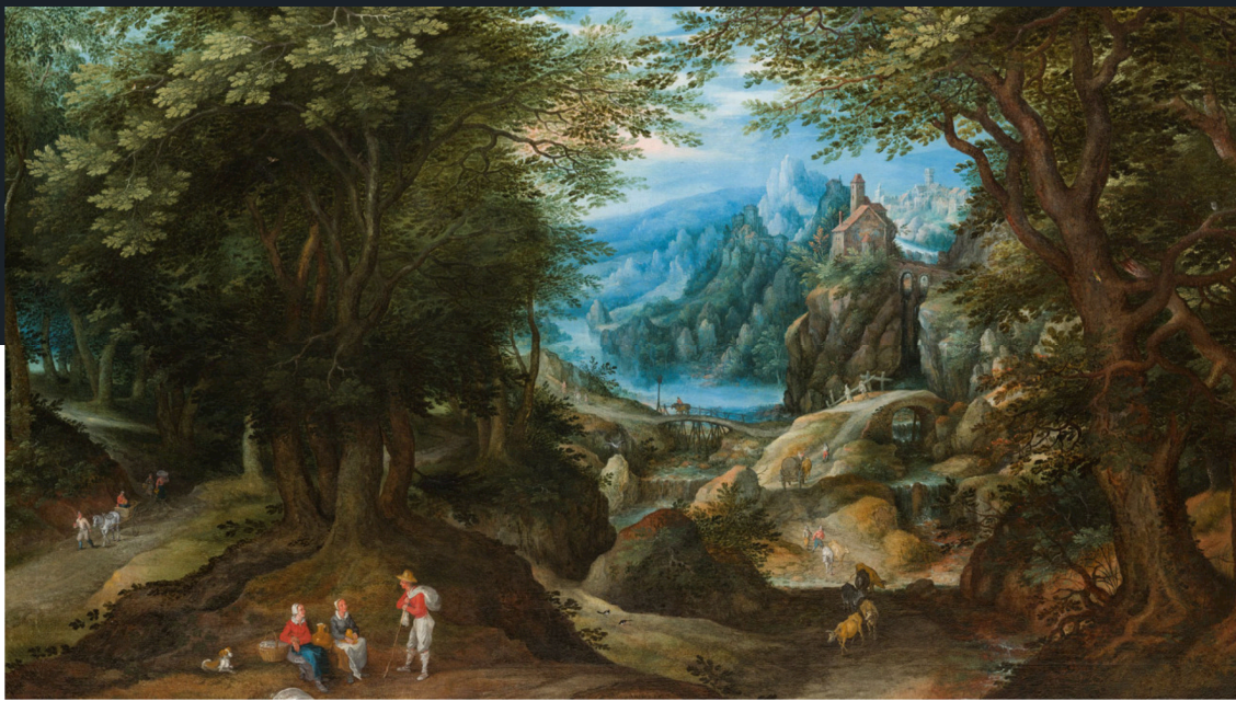
Paysage boisé s'ouvrant sur une chaîne de montagnes, avec la participation de l'atelier de Jan Brueghel l'Ancien, pour les figures, 117 x 173 cm

Créé en 1901, le Syndicat National des Antiquaires (SNA) défend plus de 250 marchands français et internationaux. Du 28 janvier au 4 février, 45 d'entre eux participent à la 69e édition de la Brafa, l'incontournable foire annuelle organisée à Bruxelles.