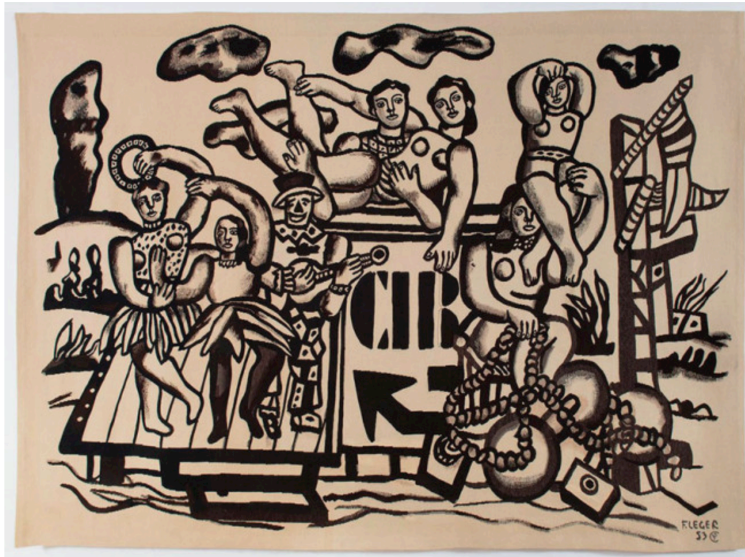
Fernand Léger, La grande parade, 240 x 320 cm, Atelier coquille Prince, Aubusson, conçue en 1953 et réalisée en 1960