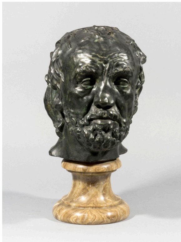
Auguste Rodin, Masque de l'homme au nez cassé, version dite de type II, 2ème modèle, (1863–1864), fonte vers novembre 1926, bronze à patine noir vert nuancé, onyx (piédouche) H. 25,7 x L. 19 x P. 21 cm, Galerie Nicolas Bourriaud

Protecteur et promoteur de la profession d'antiquaire au quotidien, le SNA s'investit dans toutes les grandes problématiques liées au marché de l'art, comme la valorisation culturelle du métier de marchand, la défense des savoir-faire et de l'expertise, et bien sûr, les questions d'ordres juridique et fiscal. En 2023, le syndicat est intervenu avec détermination auprès des pouvoirs publics (ministère de la Culture et ministère de l'Économie) pour s'élever contre la directive européenne adoptée en avril 2022 qui prévoyait de faire passer le taux de TVA à l'importation des œuvres d'art de 5,5 à 20 % à partir de janvier 2025.