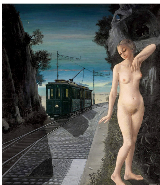
Paul Delvaux, La fin du voyage, 1968, huile sur toile, signé et daté en bas à droite – signé, titré et daté au dos, 165,1 x 145 cm, Opera Gallery

Brafa Art Fair , Brussels Expo, Palais 3 & 4, place de Belgique 1, 1020 Bruxelles, du 28 janvier au 4 février.