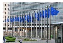
The entrance to the Berlaymont Building, headquarters of the European Commission.

Although not being introduced in Great Britain following Brexit, the regulation was repealed except in Northern Ireland, the change will still impact many art, antiques and antiquities dealers who trade into the European Union.